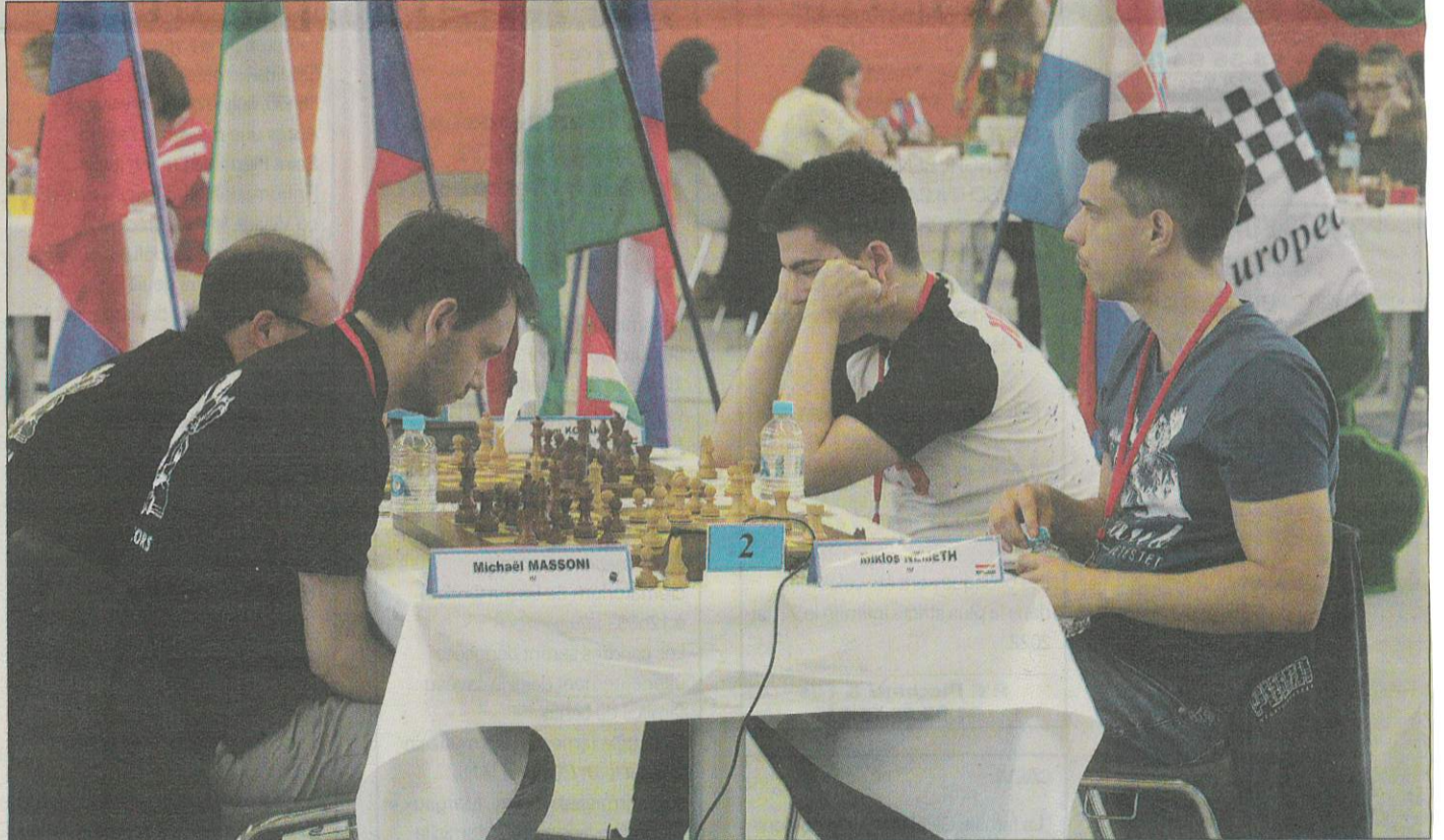
L'équipe corse en duel sur l'échiquier avec l'équipe de Hongrie.